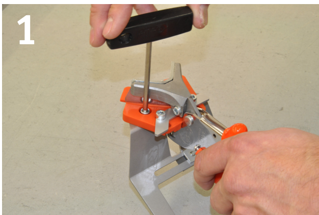
Rahmenstütze anschrauben Screw on position brace