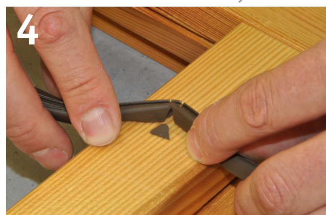
Ausklinkung und Entlastungsschnitt Notched gasket and relief cut