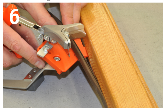
Für Endschnitt Anschlag wie in Abb. anlegen For final cut