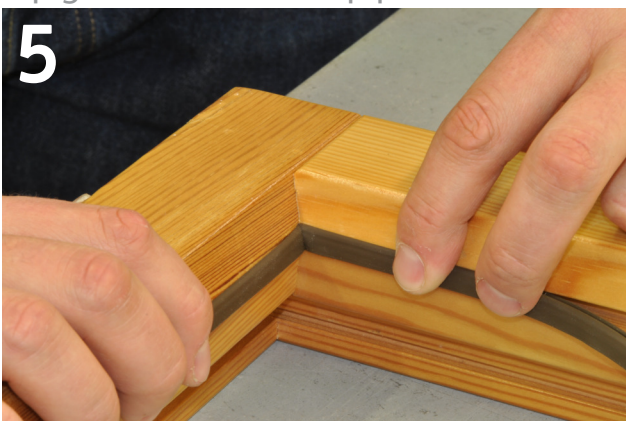
Dichtung in die Ecke einziehen Pull gasket into the corner