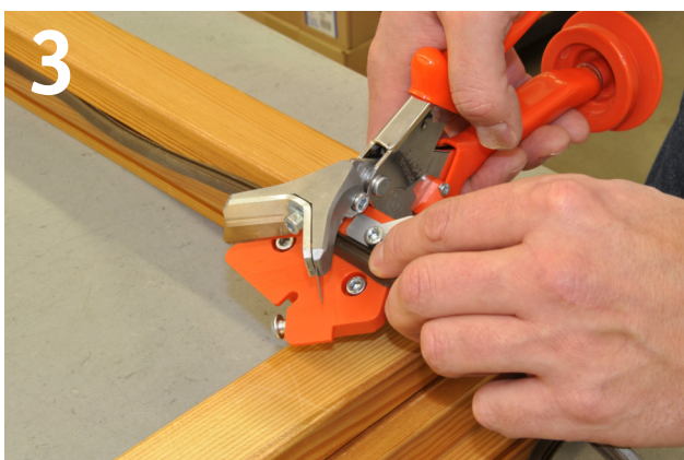
Dichtung an Anschlag halten und schneiden Keep gasket close to stop plate and cut